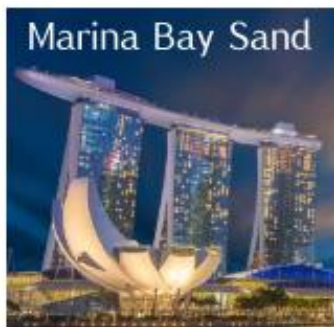
Marina Bay Sand

นำท่านเดินทางสู่ สิงคโปร์ มีชื่ออย่างเป็นทางการว่า สาธารณรัฐสิงคโปร์ เป็นนครรัฐสมัยใหม่และเป็นประเทศที่เป็นเกาะขนาดเล็กที่สุดในเอเชียตะวันออกเฉียงใต้ ประเทศบนเกาะเล็กๆ แต่มากด้วยความเจริญทางเศรษฐกิจ ที่รวบรวมความหลากหลายทางวัฒนธรรมและความทันสมัยได้อย่างลงตัว ถึงแม้สิงคโปร์จะมีพื้นที่ใช้สอยค่อนข้างจำกัด แต่นี่ก็กลับมีแหล่งท่องเที่ยวสวยๆ มากมายไว้คอยให้ผู้คนจากทุกสารทิศได้ไปเที่ยวและพักผ่อนกัน และด้วยความสวยงามอลังการของสถานที่ท่องเที่ยว