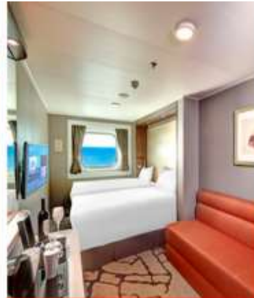
Oceanview Stateroom with Window