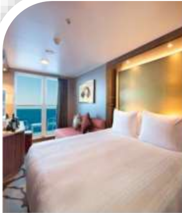
Oceanview Stateroom with Balcony