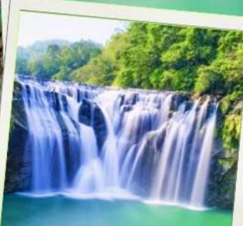
น้ำตกซือเฟิ่น